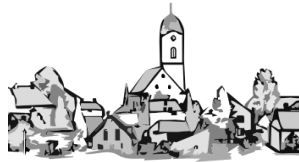
Hohenschambach mit Filialen Laufenthal und Haag